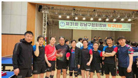
제31회 강남구협회장배 탁구대회 입수현황